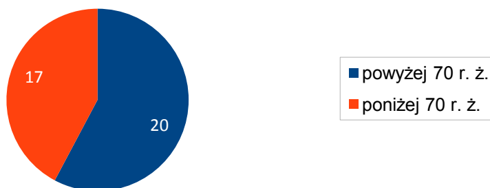
Liczba osób, które skorzystały z Programu „Wspieraj Seniora”

Usługa wsparcia polegała w szczególności na: zrobieniu i dostarczeniu zakupów, dostarczeniu żywności z Podprogramu POPŻ, wykupieniu leków, a także innych formach pomocy, tj. informowaniu o możliwości skorzystania z programu, wsparciu psychicznym czy dostarczeniu paczek świątecznych.